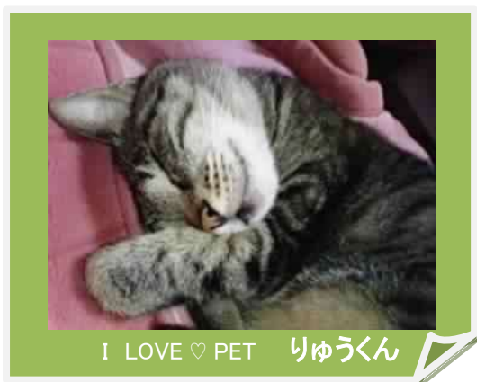
I LOVE ♥ PET りゅうくん