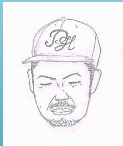
M香ちゃん 作 【S廣氏】 「キャップが、似合うねっ♪(*^_^*)」

そこで！新企画としてハピドロ似顔 絵対決を開幕することと相成りまし た\(^o^)/