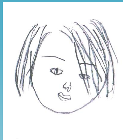
U乃ちゃん 作 【M香ちゃん】 「おかげで絵が上手くなりました。」

ハピドロエース M香ちゃんと対戦したい挑戦者求む！あなたも、M香ちゃんを描いてみませんか？