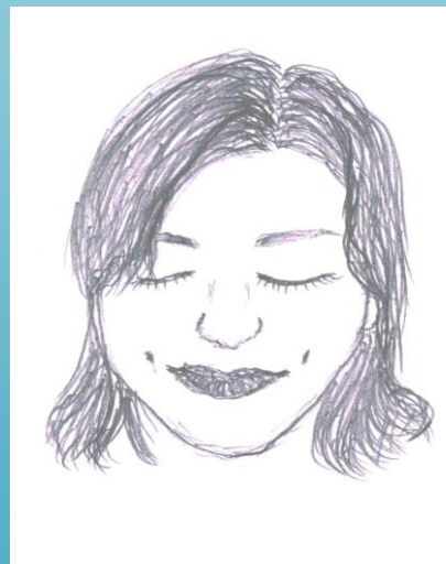
M香ちゃん 作 【U乃ちゃん】 「えくぼが、チャームポイント♪(*^_^*)」

そこで！新企画としてハピドロ似顔絵対決を開幕することと相成りました\(^o^)/